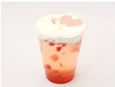
春色苺ソーダ 税込 600 円

レストラン「ワイルドダイニング」では、桜をモチーフにした限定メニューが登場します。大きく開けた窓から桜を眺めながら食事を楽しめるほか、テイクアウトして、お花見フオトスポットで写真撮影するのもおすすめです。