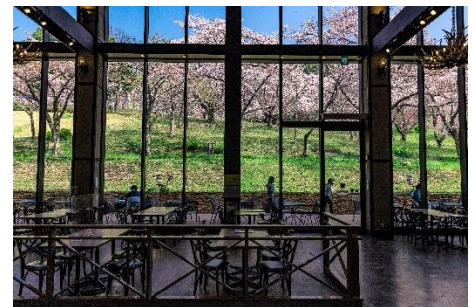
レストラン「ワイルドダイニング」 から見える桜