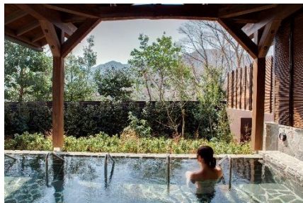
高濃度炭酸泉風呂

遊園地に隣接する「さがみ湖温泉うるり」では、3月16日（土）～31日（日）の期間、露天高濃度炭酸泉風呂にて「さくら風呂」を楽しめます。ピンク色に染まった温泉で、桜の香りを楽しみながら身も心も癒されます。また、お食事処では、春メニューが登場します。