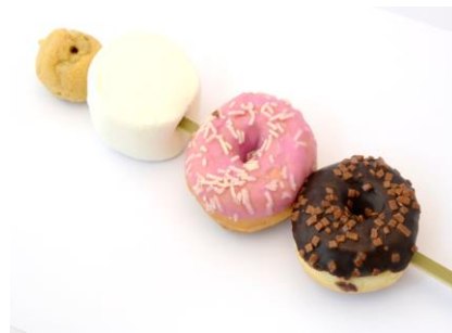
お花見串ドルチェ 税込 700 円