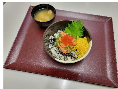
イクラとサーモンたたきの親子丼