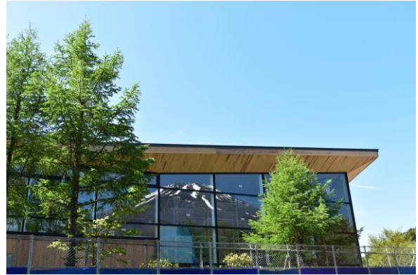
窓ガラスに映る富士山