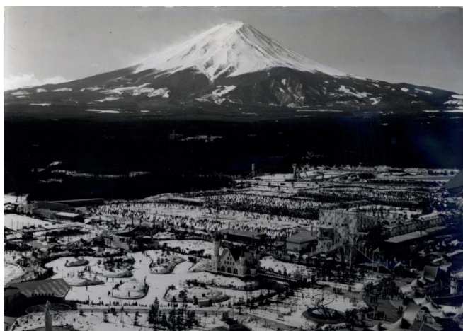
昭和46年（1971年）頃のスケートを楽しむ入園者で賑わう富士急ハイランド

【富士急ハイランドの歴史】 https://www.fujiq.jp/entertainment/history.html