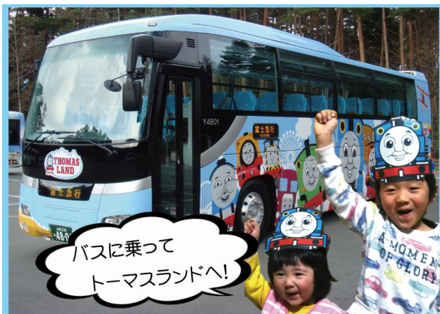
※現在運行中のトーマスランドエクスプレス