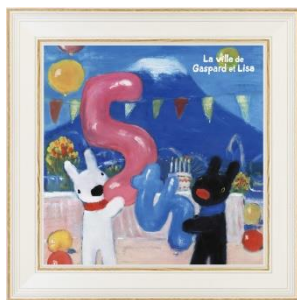
アートフレーム 2,160円

リサとガスパールが5周年をお祝いしている記念原画デザインの、アートフレーム、バンダナなど、リサとガスパール タウンでしか買えないオリジナルグッズが続々と登場します。