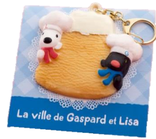
クッキーストラップ 800円