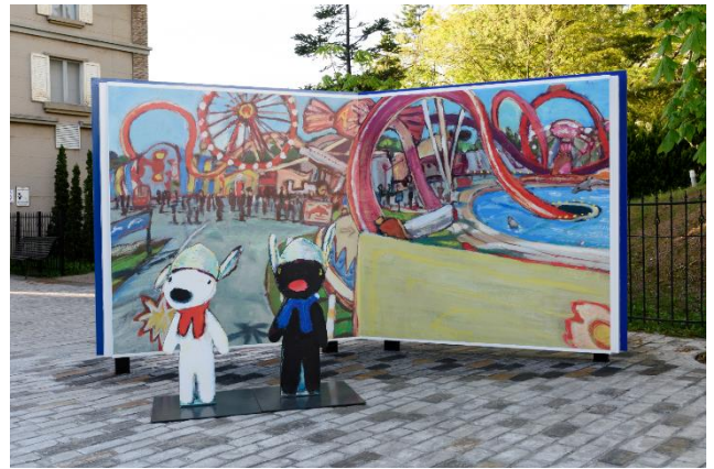
絵本「リサとガスパール ゆうえんちへいく」 テーマのフォトスポット