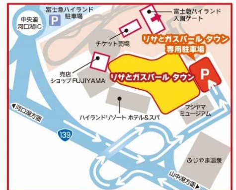
リサとガスパール タウン専用駐車場のご案内

リサとガスパール タウンに隣接する駐車場がございます。タウン内のお買い物金額に応じて、最大4時間無料でご利用いただけます。