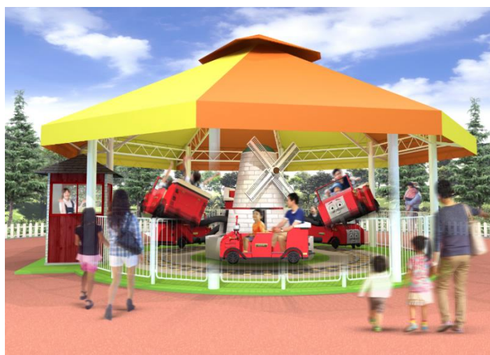
<ホッピング ウィンストン>