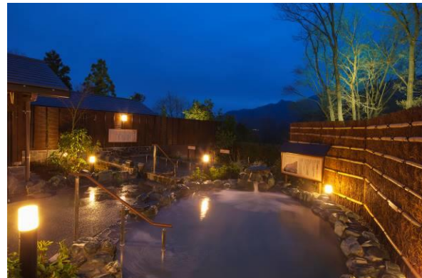
さがみ湖温泉うるり