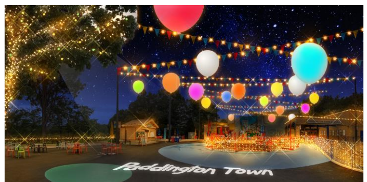
「パディントン タウン」夜のイメージ