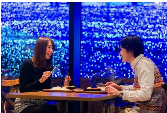
ワイルドダイニング

園内中心部にあるレストラン「ワイルドダイニング」では、イルミネーションの幻想的な景色を楽しみながら温かい料理をお楽しみいただけるほか、日帰り温泉施設「さがみ湖温泉うるり」も隣接しており、“イルミネーション”と“温泉”という冬の醍醐味を満喫することもできます。