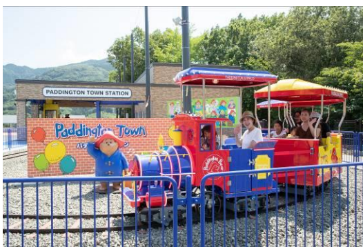
しゅっぱつ！パディントン号

今年 7 月にOPENした、イギリス生まれの人気キャラクター「パディントン ベア™」の世界初となるテーマパーク「パディントン タウン」も、夜は光と音楽に包まれ、まるでイギリスの移動遊園地に入り込んだような煌びやかな街へと姿を変え、4 種類のナイトアトラクションを楽しむことが出来ます。