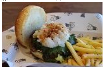
和風おろしバーガー 1,200円