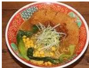
豚カツラーメン 1,000円