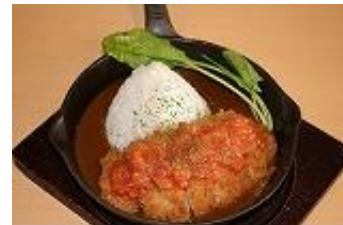
さっぱりトマツカツカレー 1,500円