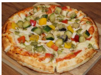
野菜とチキンのジェノパピッツァ 1,100円