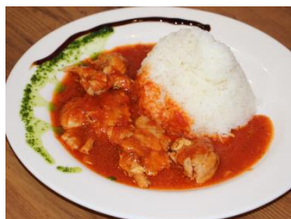
チキンのトマト煮onライス 1,100円