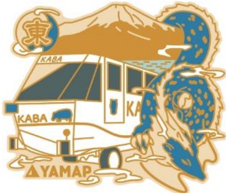
「東エリア」 森の駅旭日丘