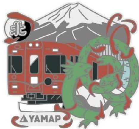
「北エリア」 富士急ハイランド