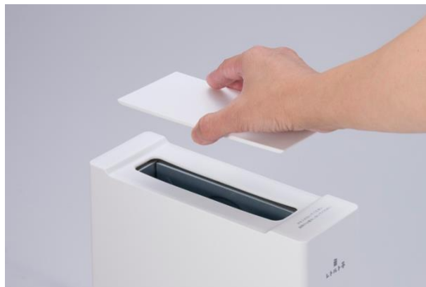
ふたを被せて衛生的に保管。