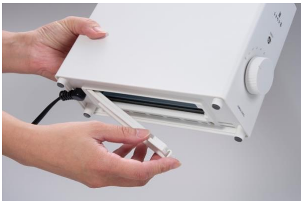
底ふたは簡単に取り外し可能。お手入れがラクラクに。

さらに、投入口をふさぐ「ふた」が付属。使用しない時のホコリの侵入を防ぎ、 衛生的に保管 できます。