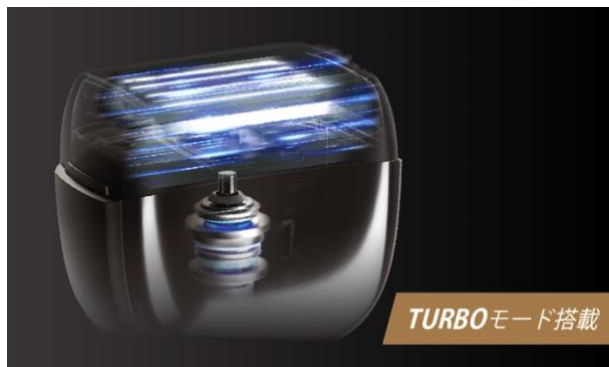
モーターの高速回転でしっかり深剃り

刃の駆動スピードを高める TURBO モードで、濃いヒゲもしっかりカット。パワフルさと快適な剃り心地を両立し、しっかりとした深剃りを実現します。