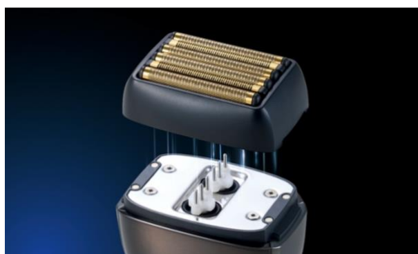
マグネット式で簡単脱着