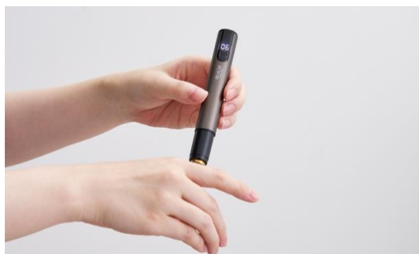
指の形に沿って刃を当てやすい