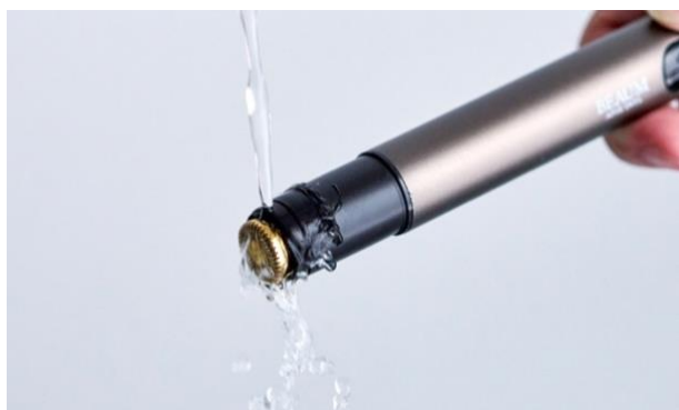
水洗い可能で衛生的

全長 139mm のコンパクトサイズ。化粧ポーチや小さなバッグにもスッキリ収まり、出張や旅行、外出先でも手軽に持ち運べます。