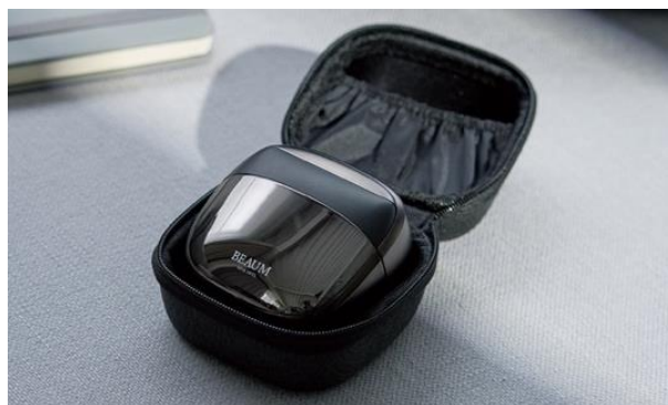
ケース付きで持ち運びも安心