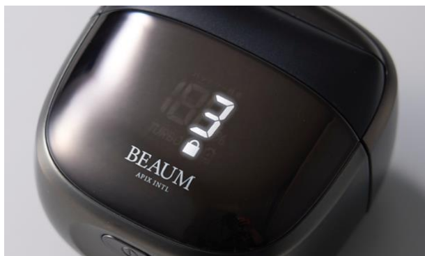
ロック時はマークをデジタル表示