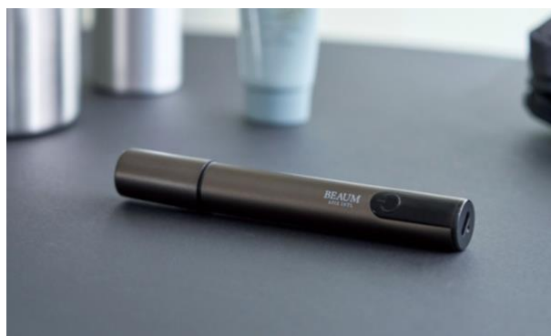
コンパクトサイズで持ち運びに便利

※ 1 IPX7：水深 1m に 30 分間浸水させる試験条件における保護等級です。使用状況や経年により防水性能は変化する場合があります。