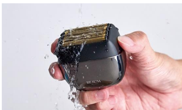
使用場所を選ばない防水設計

専用セミハードケースが付属。外出時の持ち運びにも便利で、本体を衝撃から守ります。