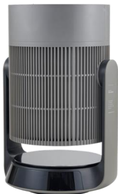
送風口を真上に向け、空気清浄機として使用可能

さらに、空間に馴染む落ち着いたスタイリッシュなデザインで、インテリアの印象を引き立てます。