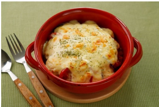
なすのグラタン風

母乳や粉ミルクの研究を活かして開発された「プラチナミルク for バランス」は、たんぱく質、カルシウムなど8種のミネラルや12種のビタミンを含む栄養バランスサポート食品で、食事に「ちょい足し」していただくだけで簡単に栄養満点ごはんをお楽しみいただけます。この機会にお試しください。