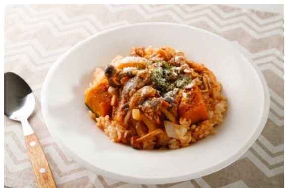
牛肉と秋野菜のトマトクリームメシ