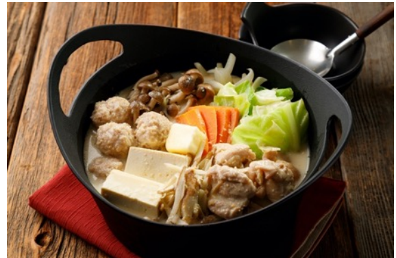
バター味噌ちゃんこ