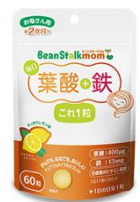
「毎日葉酸+鉄これ1粒」