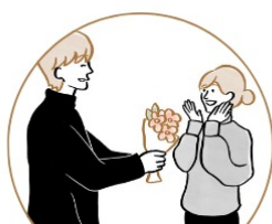
ロマンチックタイプ

下記の4つの恋愛傾向タイプに基づいて、おすすめのクリスマスデートプランを導き出します。