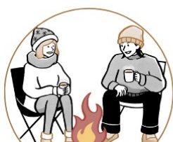
アドベンチャータイプ