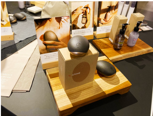
▲イベント時のブース展示。手にとってくださる方も多数いらっしゃいました。