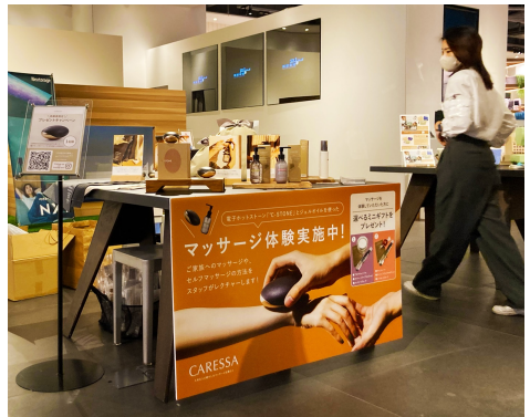
▲イベントブースの様子