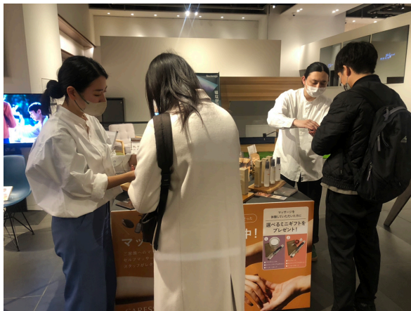
▲お客様がマッサージを体験されている様子