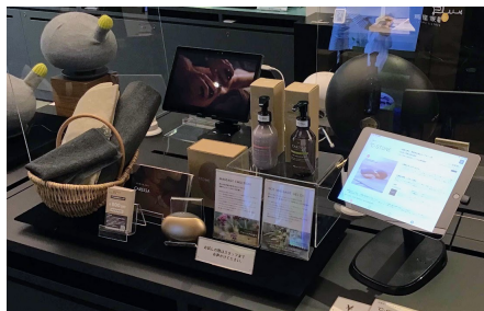
▲蔦屋家電+での出展の様子

b8ta tokyo-Yurakuchohaka 11/1~3/31 〒100-0006 東京都千代田区有楽町1-7-1 有楽町電気ビル1階 営業時間：11:00 ~ 19:30 定休日：不定休