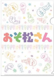
「おそ松さんクリアファイル」A・B 柄 各 400 円+税