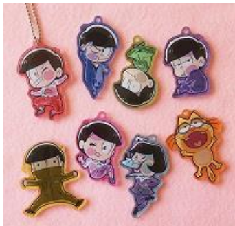
びた! でふおめ おそ松さん アクリルキーホルダー 各 580 円+税 *3/下旬発売予定