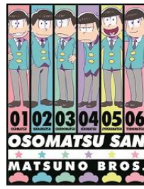
「おそ松さんフラットバッグ」A・B 柄 各 300 円+税