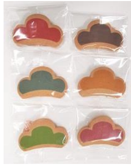
おそ松さんのおみせにきました。クッキー 1,000 円+税