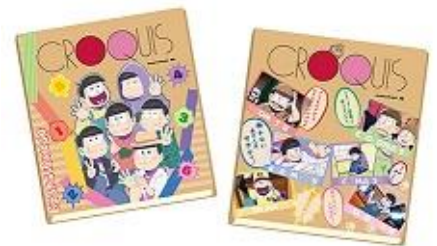
おそ松さん クロッキー帳 全2柄 800 円+税 *3月中旬~下旬発売予定