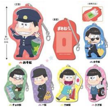
おそ松さん ダイカットバスケース 全6種 1,280 円+税 *3月中旬~下旬発売予定