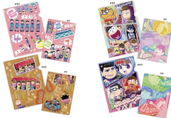
おそ松さん クリアファイルセット A/B 各 780 円+税 *3/下旬発売予定