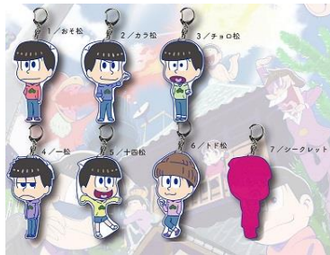
「TINY アクリルキーホルダー」7 種 各 650 円+税 *フェアスタート日より~先行販売

*「原宿店」と「大阪梅田店」で取扱商品が異なる場合がございますので店舗にご確認ください。