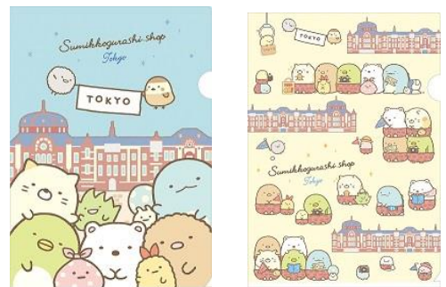
クリアホルダーセット 1種 500 円+税 サイズ:310×220mm/A4 サイズ・2 柄セット