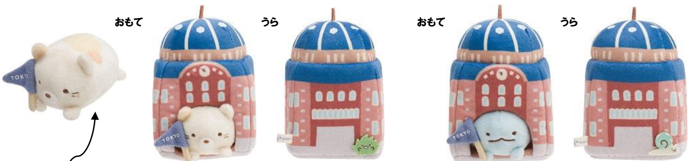
東京丸の内駅舎でのりぬいぐるみ 2種 各 1,450 円+税 サイズ:約 110×90×85mm