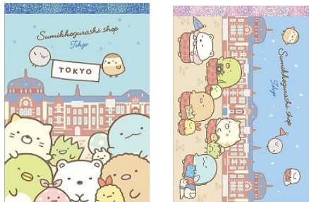
メモパッド 2種 各 350 円+税 サイズ:148×105 mm