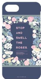
iPhone8/7/6/6s 用ケース 2,480 円+税