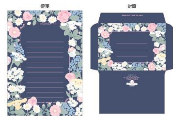
レターセット 800 円+税