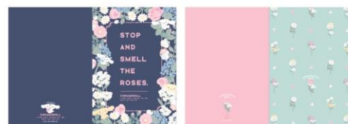
ノート 3 冊セット 1,480 円+税