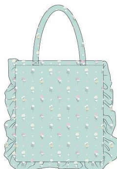
フリルトート 3,900 円+税