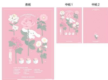
メモ帳 700 円+税