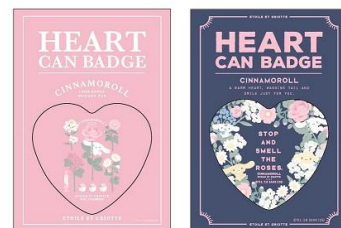
缶バッジ 2 種 各 450 円+税