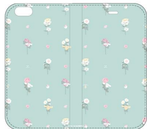
iPhone8/7/6/6s 用手帳型ケース 3,480 円+税