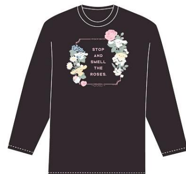
ロングスリーブTシャツ 4,980 円+税