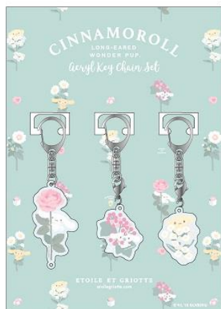
アクリルキーホルダーセット 1,680 円+税