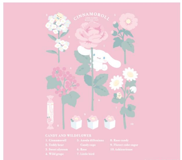
CINNAMOROLL×ETOILE ET GRIOTTE 9/15(土) START!! / KIDDY LAND (HARAJUKU & UMEDA)

■詳細: https://www.kiddyland.co.jp/event/cinnamon_etoile/