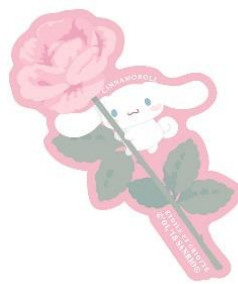
ダイカットステッカー 450 円+税