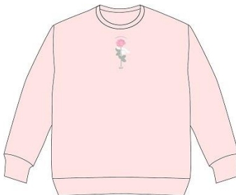
トレーナー 5,980 円+税