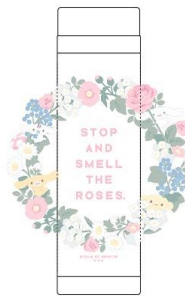
ステンレスボトル 3,680 円+税