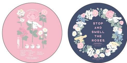
缶ミラー 2 種 各 600 円+税