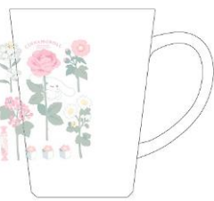
マグカップ 1,800 円+税