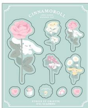
シール(シートタイプ) 700 円+税