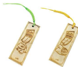
千札ストラップ 2種 各 800 円+税