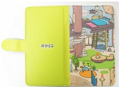
スマホカバー 2,980円+税