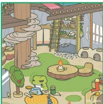
ハンドタオル 650円+税