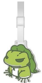
ネームタグ 1,000 円+税