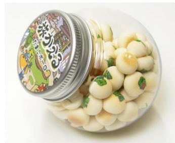
たまごボーロ 600円+税