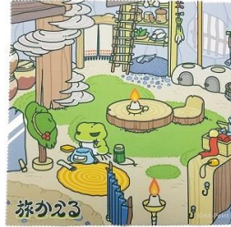
マルチクリーナークロス B 500 円+税