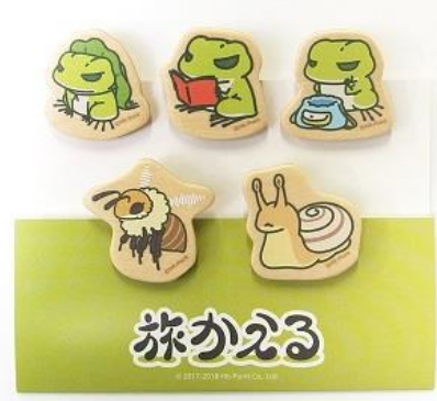
木製クリップ 900円+税