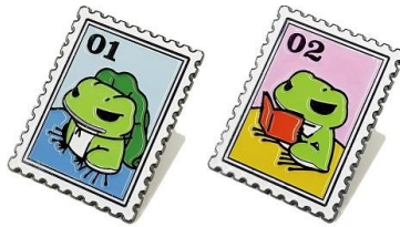
切手風ピンズ 2種 各 800 円+税