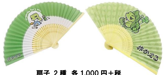
扇子 2種 各 1,000 円+税