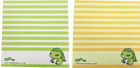
マルチクリーナークロス A 2種 各 500 円+税