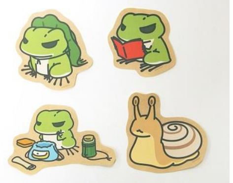
スイーツケースラベル 4種 各400円+税