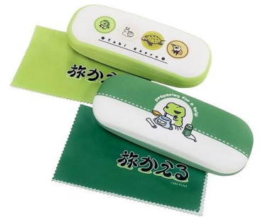
メガネケース 2種 各 1,200 円+税