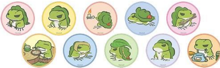
トレーディング缶バッジ 10種 300 円+税