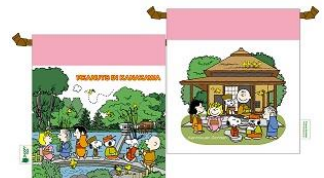
巾着 兼六園 650円+税