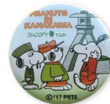
缶バッジ 兼六園 200円+税