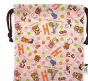
巾着 チラシ柄 兼六園(17×19cm) 650円+税