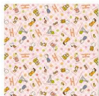
小風呂敷 チラシ柄 兼六園 800円+税