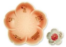
桜小皿&箸置き 兼六園 (限定150個) 1,280円+税