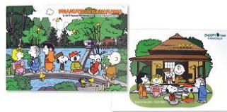
クリアファイルA4 兼六園 280円+税