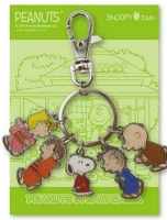
5連キーチェーン 兼六園 (限定250個) 1,380円+税