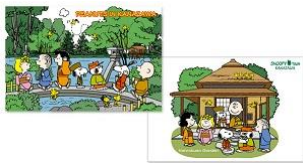
ポストカード2枚セット 兼六園 300円+税