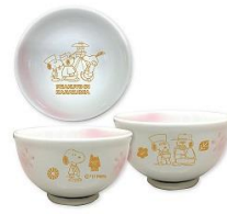
湯のみ 兼六園 (限定100個) 900円+税