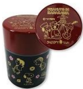
茶筒 兼六園 (限定100個) 1,200円+税