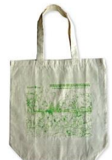
エコバッグ 兼六園 500円+税