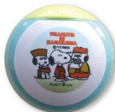
e-ma のど飴 兼六園 (グレープ味)380円+税