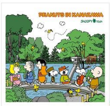
小風呂敷 兼六園 (限定100個) 1,000円+税

■“スヌーピーと PEANUTS の仲間たちが金沢の名所「兼六園」を散策”をテーマにした「金沢店」限定商品が続々登場。*発売初日に限り数量限定はお一人様一会計につき1個までの販売となります。