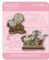
ピンバッジセット 兼六園 (限定150個) 1,380円+税