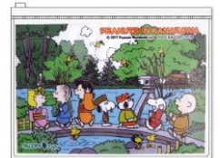
ジッパーケース 兼六園 350円+税