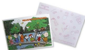
メモ 兼六園 280円+税