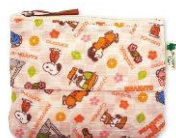
ティッシュポーチ チラシ柄 兼六園 1,200円+税