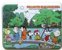
缶キャンディ 兼六園 (いちごみるく)580円+税