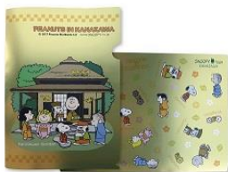
クリアファイルA4GD 兼六園 (限定500個) 380円+税