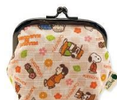
マチ付がま口 チラシ柄 兼六園 1,200円+税