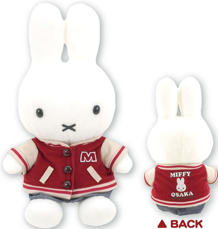
アメカジ ミッフィーぬいぐるみ 4,000円(税抜)