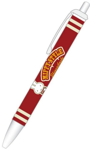
ボールペン 600円 (税抜)