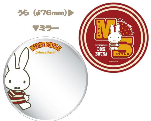
缶ミラー 600円 (税抜)