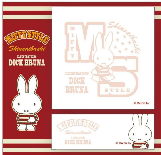
付箋セット 300円 (税抜)