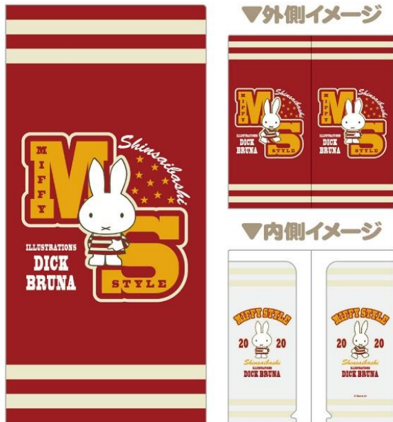
チケットファイル 300円 (税抜)