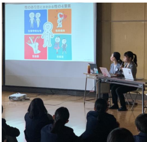
2021年に公立中学校で実施した性教育授業の様子

そのような教育現場での性教育のお悩みや課題を解決するべく、性教育従事者向けの情報が集まるお役立ちプラットフォームとして『withセイシル』を開設いたします。