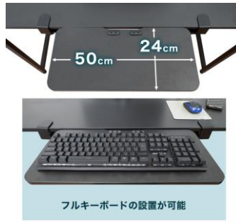
フルキーボードの設置が可能