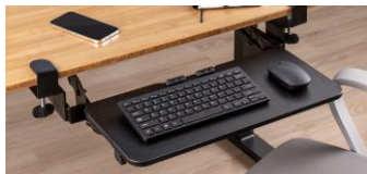
自分の机にクランプで取り付けるだけ