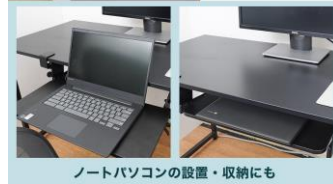
ノートパソコンの設置・収納にも