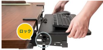
天板を好きな高さで固定できてグラグラしない