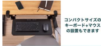
コンパクトサイズのキーボード+マウスの設置もできます