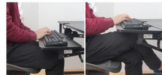
かんたんに取付位置移動

<仕様>・サイズ/幅 655×奥行 400×高さ 150(mm) ・重量/約 3.7kg