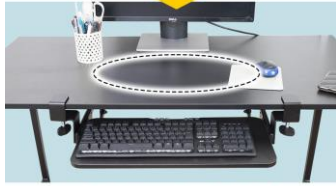
後付けのトレイで机が広く使えます