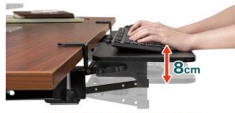
天板の高さを変えることができます