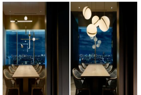
雰囲気異なる2つの個室