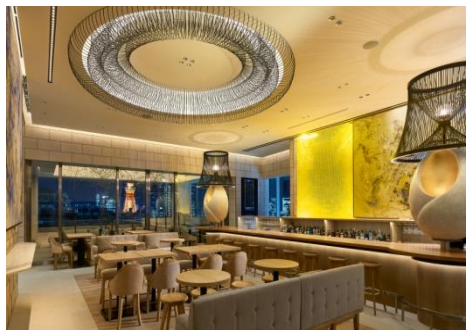
カジュアルに使えるパースペース

バー&ラウンジを抜けると開放的なバルコニーが広がり、ダイニングは柔らかな光に包まれたミュージアムのような空間。それぞれに趣の異なるプライベートルームもご用意。バータイム、ディナー、ミッドナイトのティータイム等、おもしろいおもしろいにお過ごし下さい。