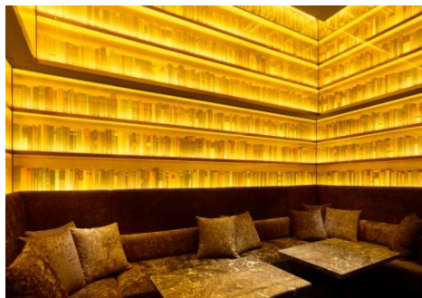
書籍に囲まれた大人のVIPルーム

インテリアデザインを手掛けたのは、国内外でインテリアに限らず、グラフィックやプロダクトといった幅広い創作活動を行っている GLAMOROUS co.,ltd.代表の森田恭通(もりた やすみち)氏。