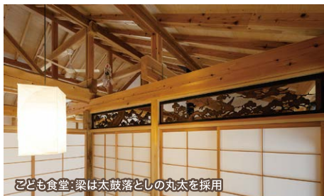
子ども食堂:梁は太鼓落としの丸太を採用