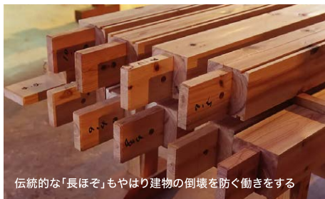
伝統的な「長ほぞ」もやはり建物の倒壊を防ぐ働きをする