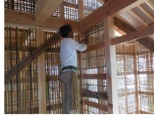
土壁の中は貫と呼ばれる構造フレームになっています これは建物がある程度変形しても倒壊を防ぐ働きをします

檜、栗、松、杉、檜など日本の木材をふんだんに、梁は太鼓落としの丸太を採用しました。 建物の出入口にはevoltzを魅せるように「現し」仕上げにもらった。 子ども達の自由研究などに使ってもらい、少しでも建築に興味をもってもらいたい。