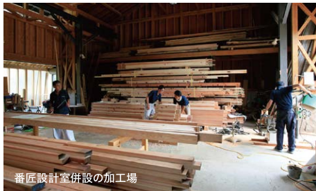
番匠設計室併設の加工場