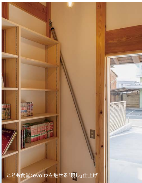
子ども食堂:evoltzを魅せる「現し」仕上げ