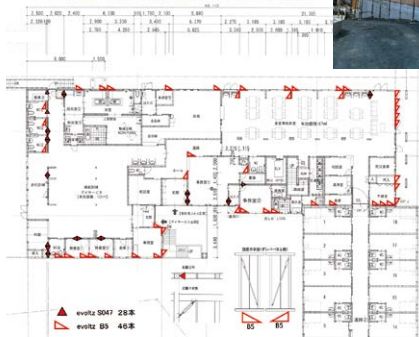
evoltz B5 x46本 evoltz S047x28本

住宅型有料老人ホーム 花梅様の配置設計にあたり、まずは建物の床面積等により建物の重量を簡易的に計算し必要本数を算出します。結果evoltz B5を46本、evoltz S047を28本となり、設計図書より構造区画および耐力壁線等を鑑み、X方向Y方向の中でバランスよく配置しています。