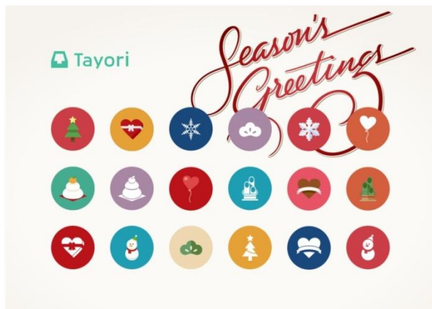
▲クリスマス・お正月・バレンタイン仕様の季節アイコン18種

Tayoriを使用した場合、お問い合わせフォームへ移るアイコンのデザインを設定することができます。紙飛行機やクエスチョンマークといった様々なデザイン、色から、お好みのデザインを選択できます。この度、12月～2月の季節感を表すオリジナルデザインがラインナップに追加され、クリスマス、お正月、バレンタインデー仕様のアイコンが設定可能となりました。