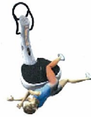
リラクゼーション