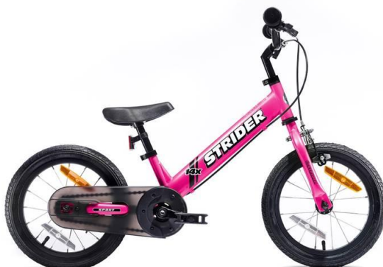
ペダルバイクモード