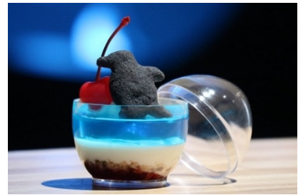
【ハッピーペンギンパフェ 2024】

商品内容 : フェアリーペンギンの青みがかったグレーの体色をイメージした、青いゼリーと滑らかなレアチーズを組み合わせた涼しげなパフェ。卵型のカップは卵からペンギンが誕生する姿をイメージしています。