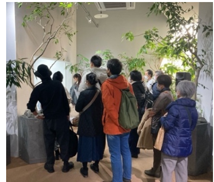
【特別体験プログラムのイメージ】

内容：普段フェアリーペンギンの担当をしている生物スタッフと共に、フェアリーペンギンの生態や AOAO SAPPORO で生活しているフェアリーペンギンたちや雛の成長の様子についてお話しします。