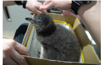
【ヒナが成鳥になるまでの過程を 随時更新します】