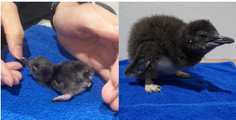
【4月7日の雛の様子（左） 5月16日の雛の様子（右）】

札幌狸小路の都市型水族館『AOAO SAPPORO』（所在地：北海道札幌市中央区、館長：山内将生）は、お客さまと一緒にペンギンの雛の成長を見守るイベント「ハッピーハッピーペンギン」の第2弾を2024年5月20日（月）より開催しますのでお知らせします。