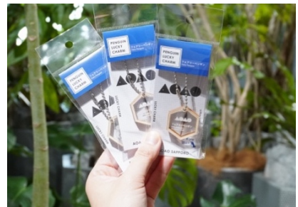
【ペンギンラッキーチャーム フェアリーペンギン Ver.】