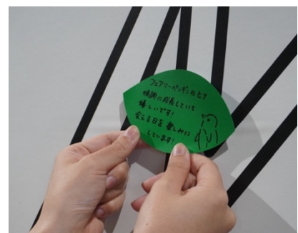
【応援メッセージを貼るイメージ】