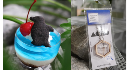
【パフェとラッキーチャームのセット商品】

商品内容 : 「ハッピーペンギンパフェ 2024」と「ペンギンチャーム フェアリーペンギン Ver.」がセットになったお得な商品です。