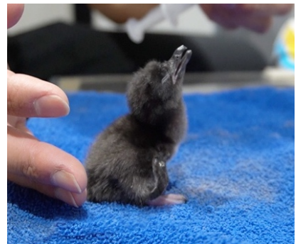
【4月8日 (誕生翌日) の雛の様子】