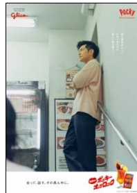
喫茶ロマン限定ポスター