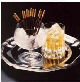
1970年代のポッキー・オン・ザ・ロック

江崎グリコ株式会社は、夏場の「ポッキー」の新しい楽しみ方として、70年代より親しまれてきた「ポッキー・オン・ザ・ロック」を現代版に進化させた「令和の！ポッキー・オン・ザ・ロック」を提案します。2022年6月14日（火）より限定デザインの小箱6種を発売し、レシピ投稿コンテストや純喫茶とのコラボなど、各種キャンペーンを開始します。同時に、的場浩司さんを起用した新ビジュアルを公開します。