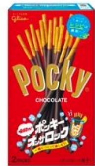
限定デザインパッケージ