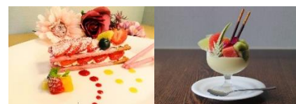
オリジナルポッキースイーツ (イメージ)

※ホテルモンテ福岡のみ 2～3 名様用のケーキを 1 室につき 1 つご用意します。