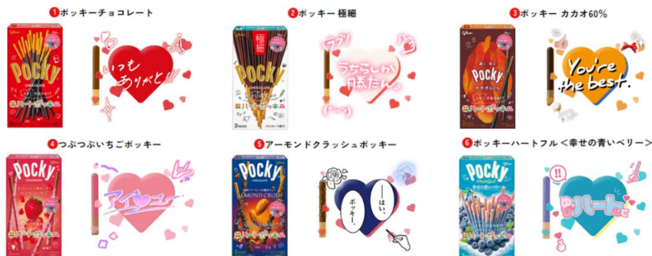
ARフィルター「#ハートポッキーAR」メッセージ例

☆詳しくはキャンペーンサイトをご確認ください： https://cp.pocky.jp/2024heart/