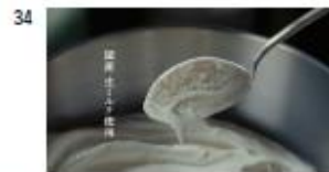
【Title】 国産 生ミルク使用