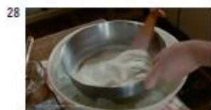
ヘル & 父 (養 NA) 余計なものは加えない。