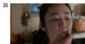
ヘル NA) 私はこの味が、