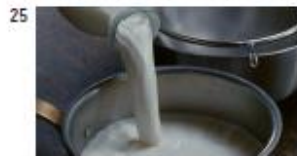
父 (養 NA) しぼりたての生ミルクだけを使う。