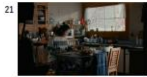
ヘル NA) と父は言った。