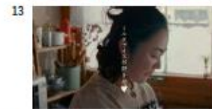
ハル MA) ミルクアイスが好きだ 【Title】 ミルクアイスが好きだ