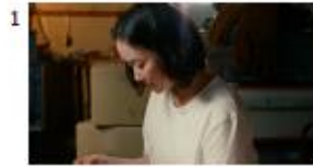
ハル) 私も牧場やれるかな