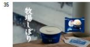
ヘル NA) 牧場しぼり 生ミルク牧場から。 【Title】 牧場しぼり