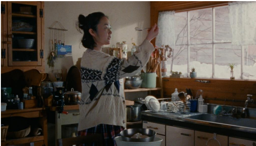
江崎グリコ 牧場しぼり「生ミルク牧場から」篇より

牧場で食べるようなしぼりたてのミルクの深い味わいを楽しめるアイスクリームを届けたいという想いで、“しぼって3日以内”の国産「生ミルク」から作ることにこだわった「牧場しぼり」。その想いを表現するため、今回は雪の残る春の北海道の牧場でのロケーション撮影を実施。また、物語の主人公には女優の黒木華さんを起用し、丹念に牛たちと向き合う牧場主を熱演いただきました。本格ミルクアイス「牧場しぼり」の魅力をメッセージする新 CM を、ぜひご覧ください。 ※「生ミルク」とは生乳のこと