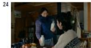
祖母 (菓子) ほい。