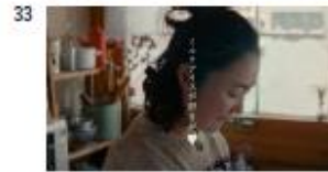
ヘル NA) ミルクアイスが好きだ 【Title】 ミルクアイスが好きだ