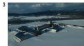
♪ { 根母 真子) やるならしっかりやんな。