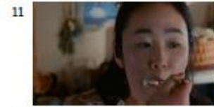
ハル NA) 私はこの味が、