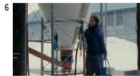
ハル 父 冬樹 NA) 牧場の生ミルクは特別だ。