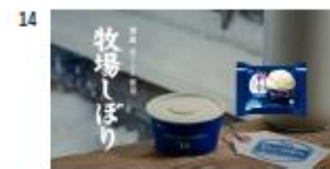
ハル MA) 牧場しばり 生ミルク牧場から。 【Title】 国産 生ミルク使用 牧場しばり