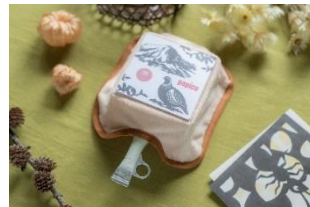
「界 アルプス」オリジナルデザイン