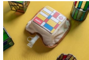
「界 雲仙」オリジナルデザイン