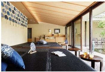
「界 鬼怒川」の湯上がり処