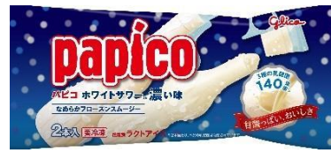
パピコ<ホワイトサワー®濃い味>

「界 雲仙」は、雲仙地獄を間近で感じることのできる地に立ち、地獄から湧き出る酸性の湯が特徴です。活力あふれる雲仙地獄ですっきりフレッシュできる「界 雲仙」では、乳酸菌の爽やかな味わいを楽しめる「パピコ<ホワイトサワー®濃い味>」を提供します。