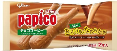
パピコ<チョココーヒ>

「界 鬼怒川」は、 くろばねあいぞめ 益子焼や おおやいし 黒羽藍染、大谷石などが館内に散りばめられ、木々に囲まれた中庭や客室からは四季の景色が望める温泉宿です。黒羽藍染や大谷石を使用した設えのなか中庭を望みながらの湯上がりを楽しめます。そんなゆったりとリフレッシュできる「界 鬼怒川」では、生チョコレートとコーヒーの深いコクを味わえる「パピコ<チョココーヒ>」を提供します。