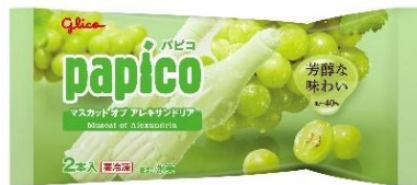
パピコ<マスカット オブ アレキサンドリア>

「界 アルプス」は、北アルプスに抱かれた長野県・大町温泉郷に位置しており、雪化粧した山々を眺めながら、冬のピンと張り詰める空気の中の湯浴みを楽しめます。大自然の安らぎを感じながらリフレッシュできる「界 アルプス」では、芳醇な香りと素材を活かした味を楽しめる「パピコ<マスカット オブ アレキサンドリア>」を提供します。