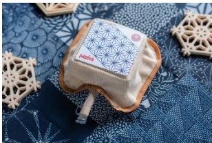
「界 鬼怒川」オリジナルデザイン

「ミニパピコたつ」とは、手を濡らさずに、パピコを食べごろななめらかさに解凍することができる、パピコ専用熱伝導カバーです。今回使用するのは「界」3施設のご当地の特徴をそれぞれ反映したオリジナルご当地デザインのもので、ご当地の文化に触れながら、パピコを解凍するまでの時間を楽しむことができます。「界 鬼怒川」では黒羽藍染や鹿沼組子の柄としても親しまれている麻の葉模様をモチーフにしており、「界 アルプス」では、長野県鳥である雷鳥やアルプスの山々をデザインしています。また、「界 雲仙」の「ミニパピコたつ」は長崎の和華蘭文化の1つであるスタンドグラスをモチーフにデザインしています。それぞれ館内や、大浴場内にも同様のデザインが施されており、湯上がりの気分を高めてくれます。