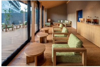
「界 雲仙」の湯上がり処