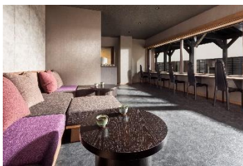
「界 アルプス」の湯上がり処