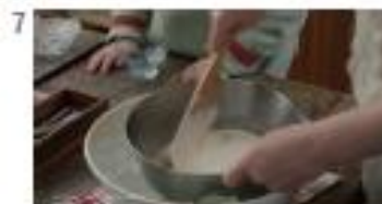
【注釈】 ※アイスクリームの作り方は CM 上の演出です