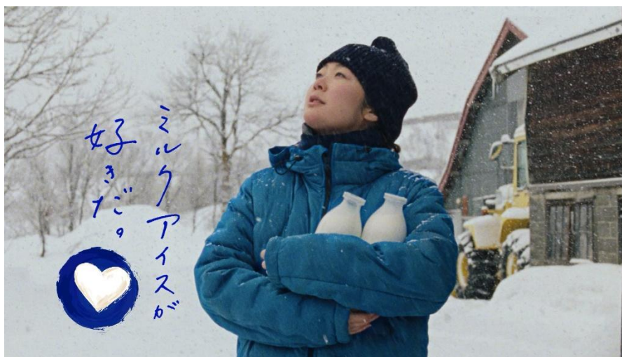
江崎グリコ「牧場しぼり」生ミルク牧場から「似てきたね」篇より