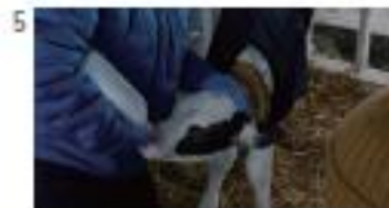
[NA] ハル： 父が種したミルクアイスは、