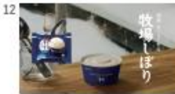
[NA] ハル：牧場しぼり [Title] 国産生ミルク使用 牧場しぼり 【注釈】 ※「生ミルク」とは生乳のこと