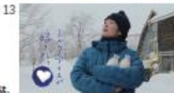
[NA] ハル：ミルクアイスが好きだ。 [Title] ミルクアイスが好きだ。