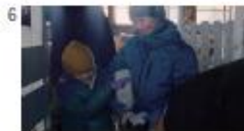
まっすぐ選んだ味がする。