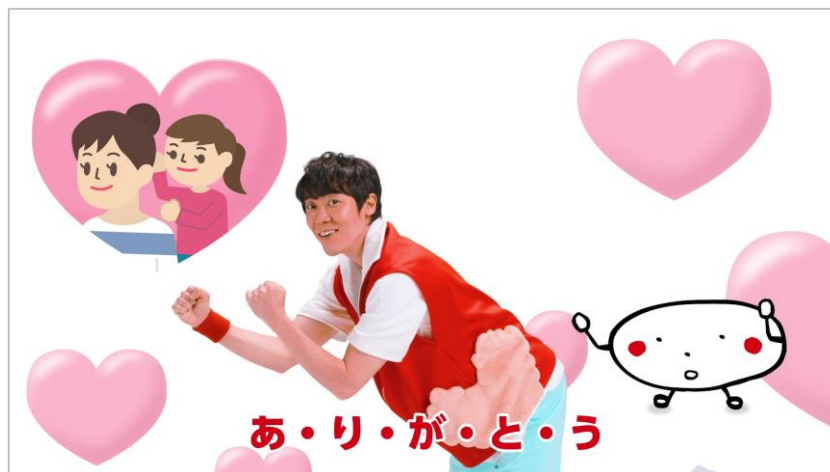
「ちょうたいそう」動画第2弾

「ちょうたいそう」は、元体操のお兄さんである小林よしひささんが監修した、おなかまわりを元気に動かす体操です。お家の中で、小さいお子様が簡単にチャレンジできるように考えられています。「ちょうたいそう」動画の第1弾は2月23日(火)より公開中で、ゾウさんやペンギンさんの動きを取り入れた体操となっています。そして今回の第2弾では、「ちょうありがとうたいそう」にパワーアップ！“ありがとう”を伝える動きを取り入れた、母の日にぴったりの体操です。