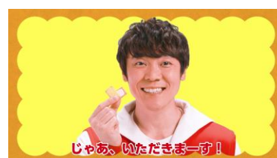
「ちょうありがとう動画」第2弾