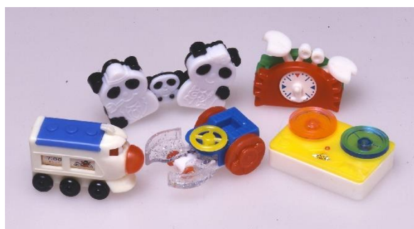
<1970 年代 大きくカラフルなおもちゃ>