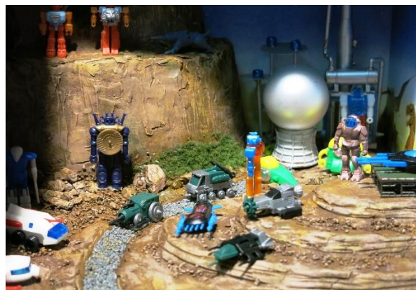
<おもちゃを使ったジオラマ>