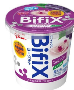
『BifiX ヨーグルト こんにゃくゼリー ぶどう味』

江崎グリコ株式会社は、ビフィズス菌 BifiX を配合した「BifiX ヨーグルト」から、おなかにうれしい食べ応えのあるぶどう味のこんにゃくゼリーをプラスした新感覚ヨーグルト『BifiX ヨーグルト こんにゃくゼリー ぶどう味』を9月30日(月)から全国で発売を開始いたします。