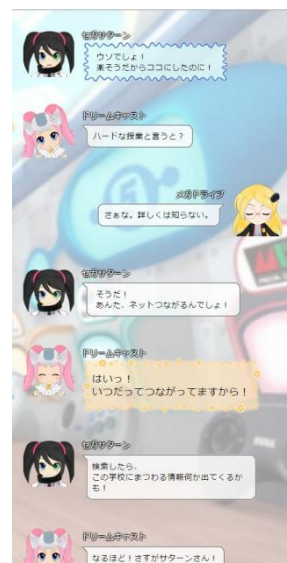
<スクリーンショット画面>