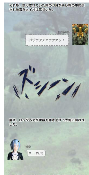
<スクリーンショット画面>