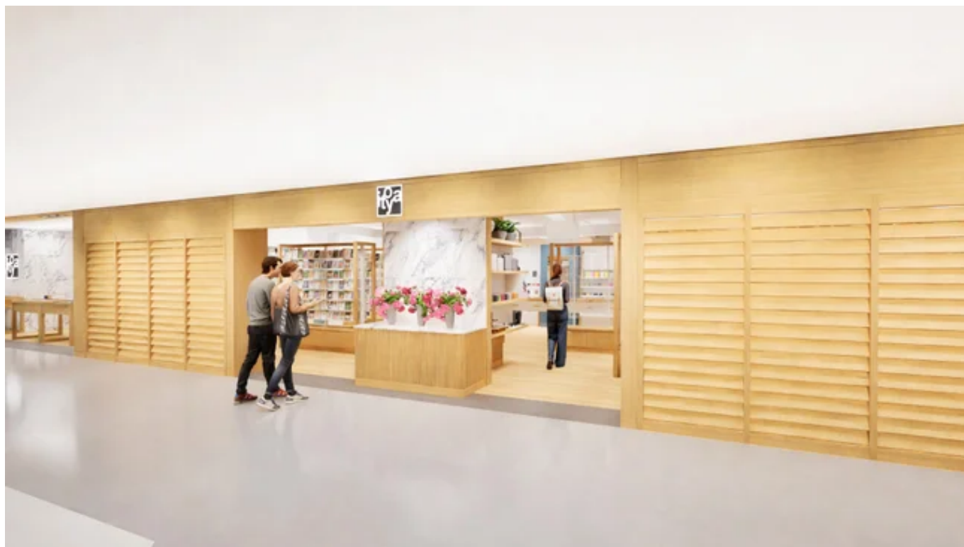
正面エントランス

店内へと一歩足を踏み入れれば、その場にいるだけで特別な気分を感じていただける、わくわくするような空間が広がります。