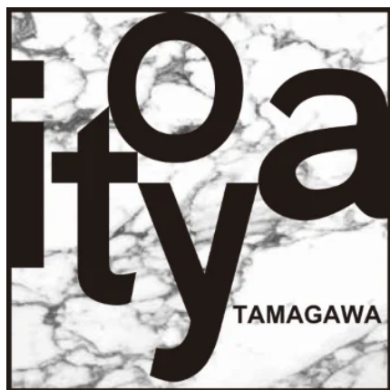
限定ロゴステッカー