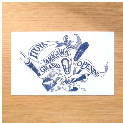
特別デザインが活版印刷された、インク吸い取り紙