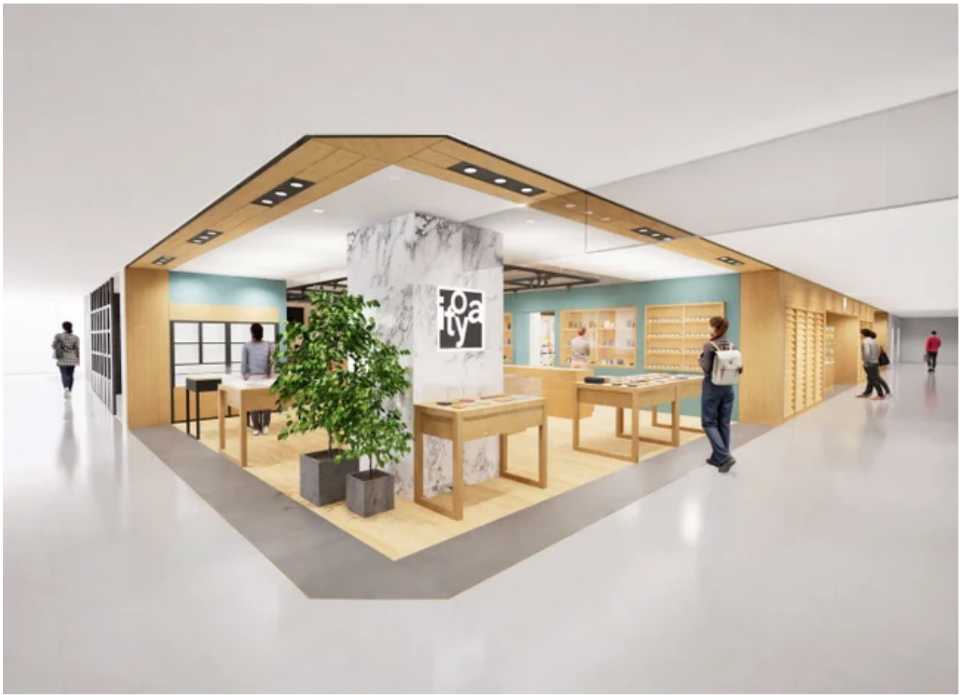
高級筆記具エリア