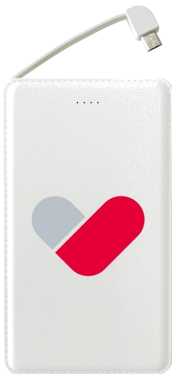
※オリジナルモバイルバッテリー

キャンペーン期間中に本キャンペーンの公式Twitterアカウント（@kenketsu_share）をフォローして、「CM投稿」をリツイートした方の中から抽選で100名様に、シェアできる「オリジナルモバイルバッテリー」をプレゼントいたします。