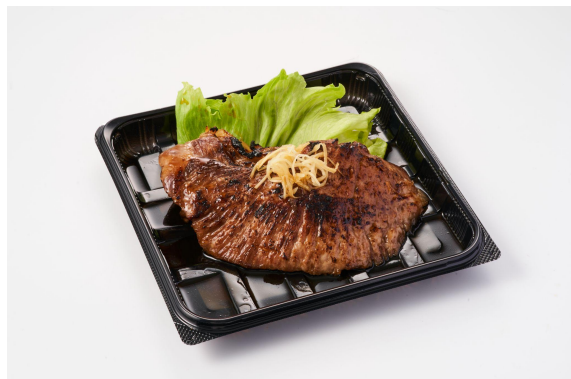
【まぐろのほっぺ煮】

ここでご紹介するのはほんの一部!!その他にもお酒、調味料を取り揃えておりますのでご来店の上、貴方だけのお気に入りの商品を見つけてみてください!!