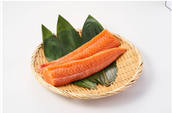
【ノルウェー産刺身用生サーモン(養殖)】