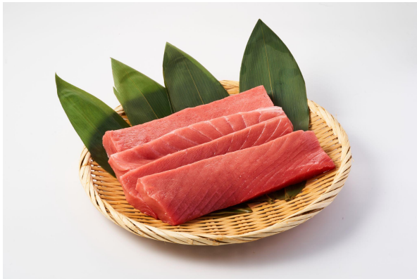
【生本マグロ中トロ(養殖)】

いくら・サーモンづくし / 北海道産ボイル・イバラカニ / 魚市場成田屋自家製いくら醤油漬