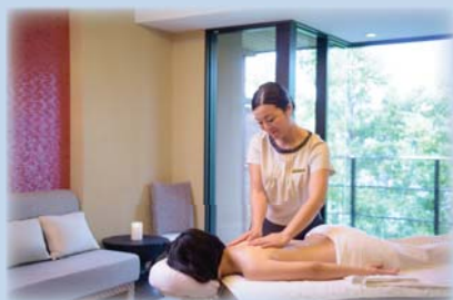
トリートメントイメージ

スージングオイルを使ったボディマッサージで、お身体にはバランスを。また心身には安らぎと深いリラックス効果をもたらします。