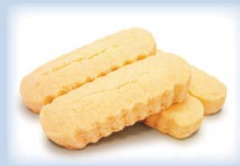
ちんすこう イメージ