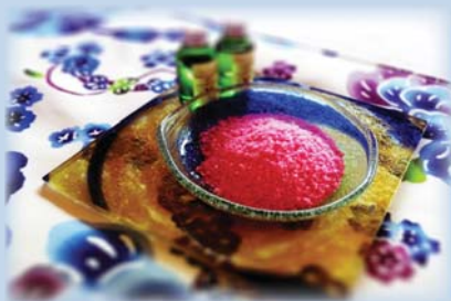
“紅塩”“トリートメントオイル”イメージ