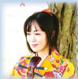
なつ子 プロフィール

※ パーティ開催中は館内に大きな音などが響く場合がございます。ご滞在のおお客様にはご迷惑をお掛けいたしますが、何卒、ご理解、ご容赦のほどお願い申し上げます。