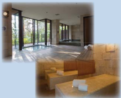
ヒートエクスペリエンスイメージ

パーソナルトレーナーが施す60分のストレッチ後に、“ヒートエクスペリエンス”(温浴施設)で広い浴槽、シャワーやドライサウナ、マイナスイオンを多く発生するといわれる風化珊瑚タイル岩盤浴をお楽しみいただけます。