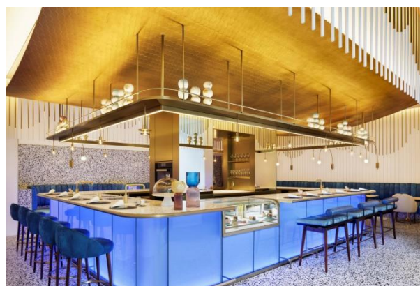
アート・ペストリー・バー「MIXup」

公式サイト: wosaka.com Instagram: instagram.com/wosakahotel/ Facebook: facebook.com/WOsakaJPN