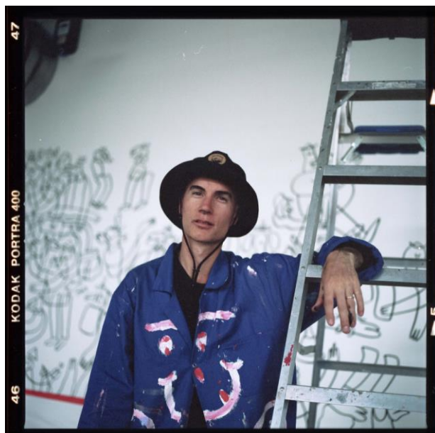
フランス出身アーティスト ルーカス・ビューフォート

～その場で描いた作品を“TO GO”できるライブペインティングや期間限定スイーツなど～