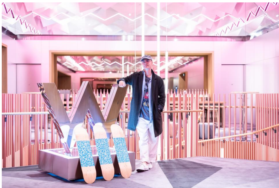
フランスの人気アーティスト ルーカス・ビューフォート

ラグジュアリー・ライフスタイルホテルW大阪(所在地:大阪府中央区南船場4丁目1番3号、総支配人:近藤 豪)は、同じく御堂筋に面する大丸心齋橋店、心齋橋PARCOと合同で、心齋橋エリアの活性化と地域との更なるつながりを目指した「心齋橋SDGsプロジェクト」に取り組んでいます。今回はプロジェクト第3弾として、フランスの人気アーティスト、ルーカス・ビューフォートが大阪の街にインスパイアされて描いた作品をチャリティーオークションに出品し、落札額のすべてを「なにわの芸術応援募金」に寄付、大阪の未来のアーティストたちを3社で応援します。