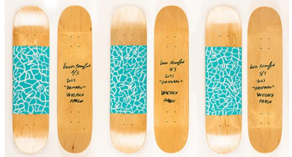
作品タイトル「Love is all」

https://www.daimaru.co.jp/shinsaibashi/lucas_auction