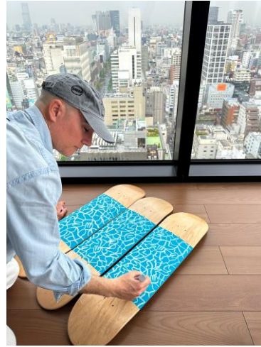
ホテルでの制作風景