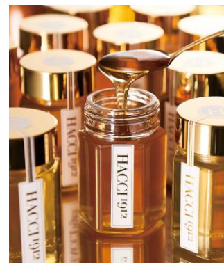
HACCI の 9 種類のはちみつを使用