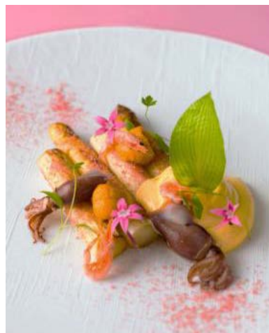
ホワイトアスパラガスとホタルイカの春ソテー（アラカト）