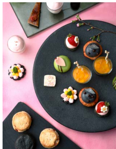
BLACK アフタヌーンティー桜ミックス