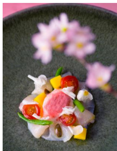
スズキのカルパッチョ ジェノバ風桜風味のヨーグルトエスプーマ