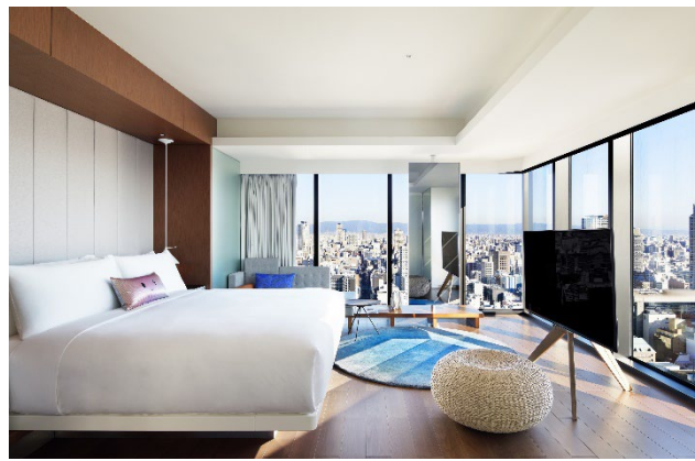
マーベラススイート